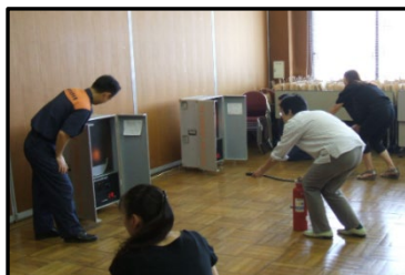
消火器の取扱い訓練