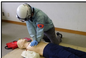
心肺蘇生法、AED取扱い訓練