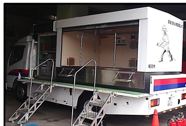
起震車による地震体験