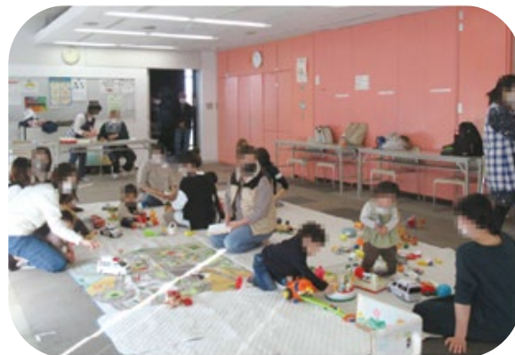
地域の親子の居場所「子育てサロン」