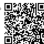
▲自治会町内会 DX 応援事業 Web ページ

市民局地域支援部地域活動推進課 担当 松永、石栗 電話 045-671-2317 /FAX 045-664-0734 Eメール sh-chiikikatsudo@city.yokohama.lg.jp