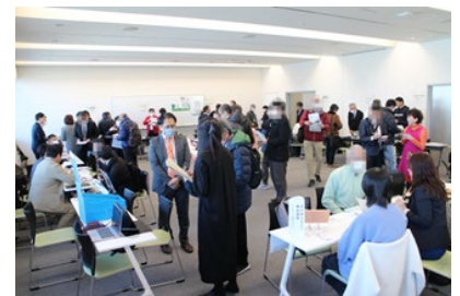
▲事業者ブースで説明を受ける自治会町内会の様子